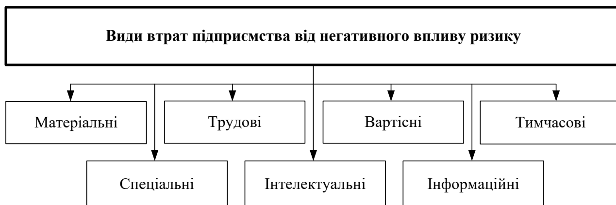
Рис. 2. Види втрат підприємства від негативного впливу ризику

Форма втрат від підприємницької діяльності приймається до уваги в трьох варіантах вираження: абсолютному, відносному і проміжному. Методологія оцінки втрат виділяє, в залежності від розглянутих ресурсів, такі їх види, що представлено на рис. 2.