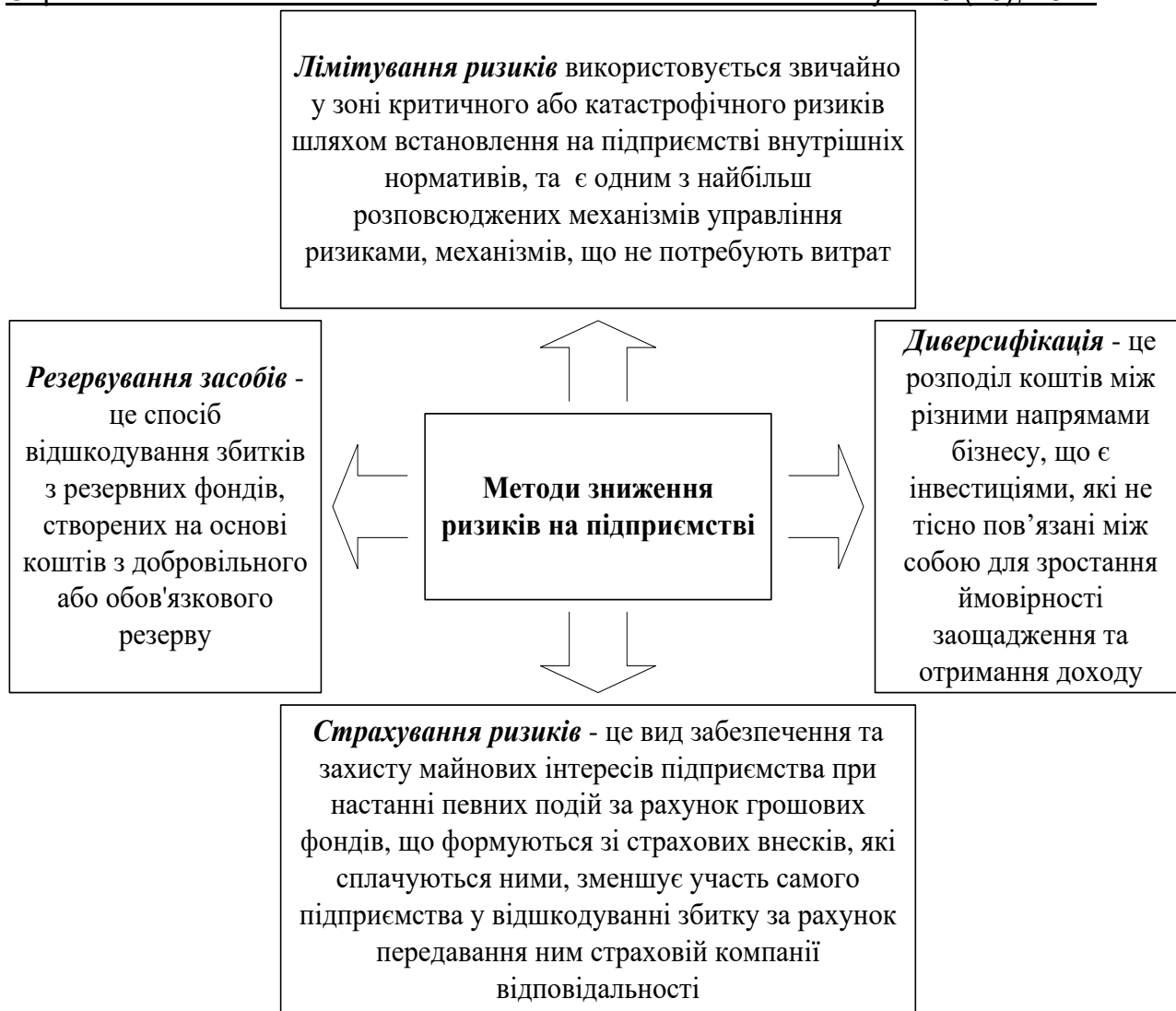
Рис. 4. Методи зниження ризиків на підприємстві

У випадку уникнення ризику повністю необхідно відкидати будь-які заходи, які можуть бути запропоновані для його зменшення. Цей рішучий захід зводить ризик до значного зниження.