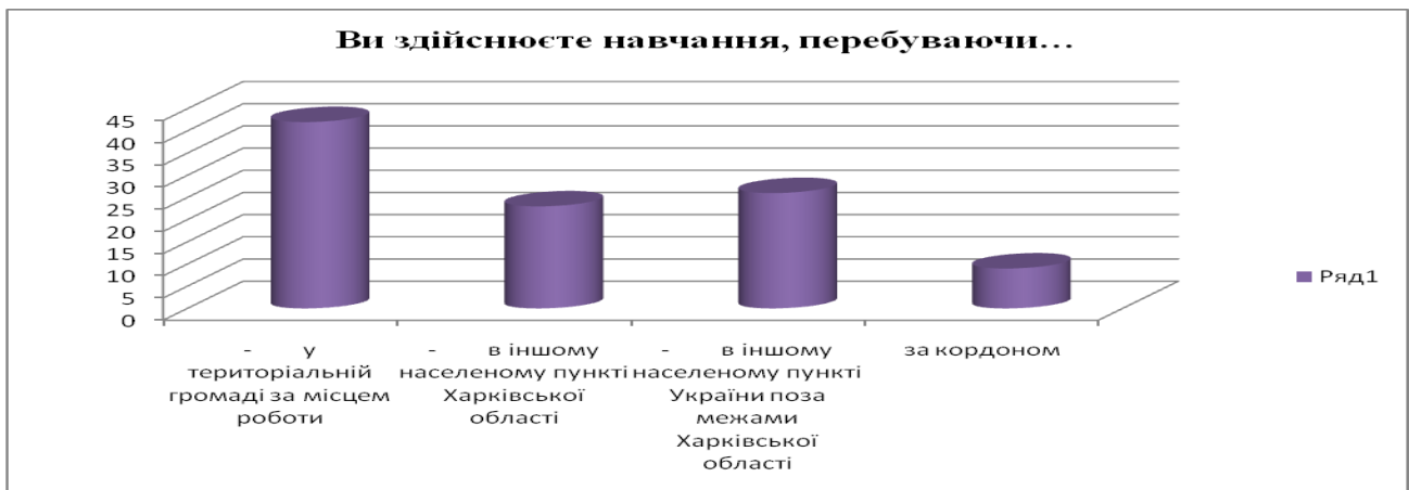
Рис. 2. Ви здійснюєте навчання, перебуваючи...

Результати перших двох запитань дали змогу прийняти управлінське рішення Академії щодо форми навчання на курсах підвищення кваліфікації та якісно організувати роботу з педагогами.